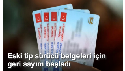
Eski tip sürücü belgeleri için geri sayım başladı