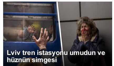
Lviv tren istasyonu umudun ve hüznün simgesi