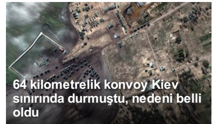
64 kilometrelik konvoy Kiev sınırında durmuştu, nedeni belli oldu