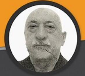
FETÖ ELEBAŞI FETULLAH GÜLEN

Emniyet Genel Müdürlüğü Terörle Mücadele Daire Başkanlığı, FETÖ elebaşı Gülen'in tüm kitap ve vaazları ile soruşturmalarda elde edilen belgeler, mağdur, müşteki ve tanık ifadeleri doğrultusunda 181 sayfalık "FETÖ'nün ideolojisi" raporu hazırladı