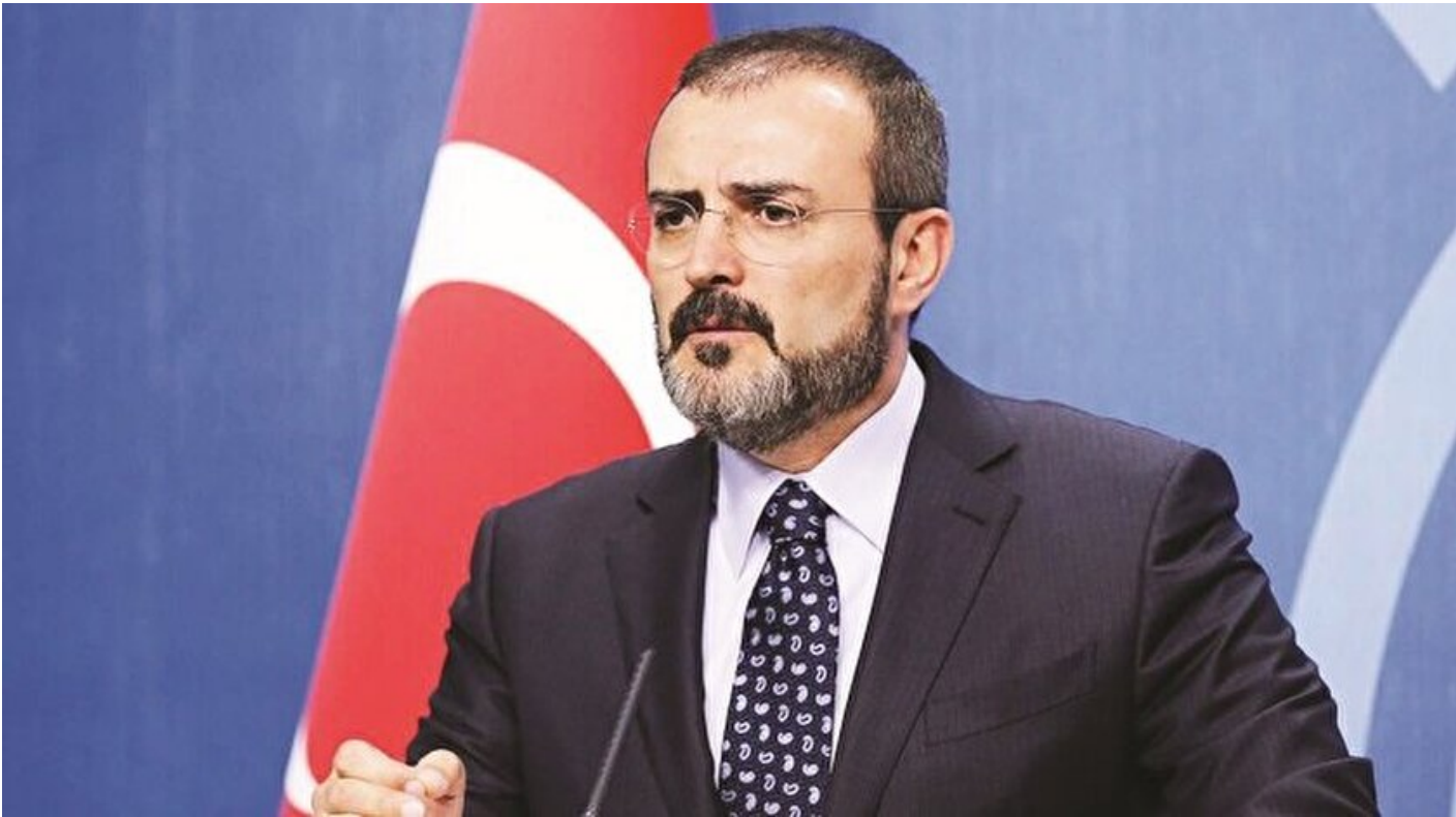
AK Parti Genel Başkan Yardımcısı Mahir Ünal