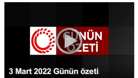
3 Mart 2022 Günün özeti