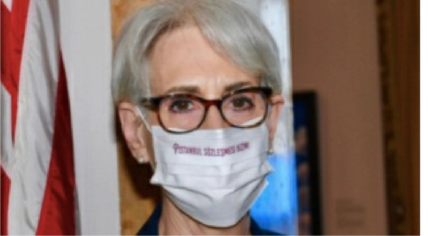
Sherman Türkiye'ye geliyor