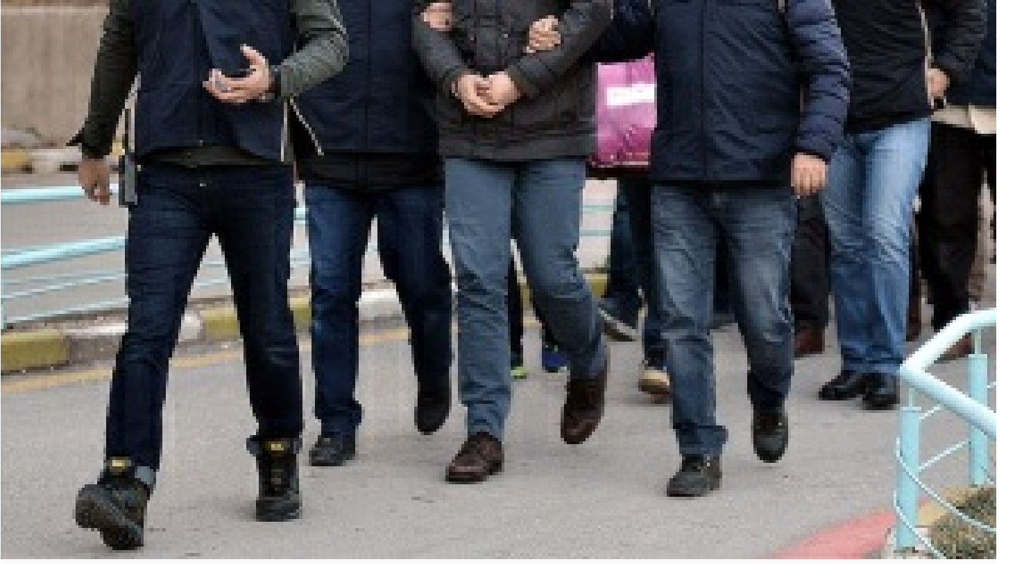
Ankara'da FETÖ operasyonu: 10 gözaltı