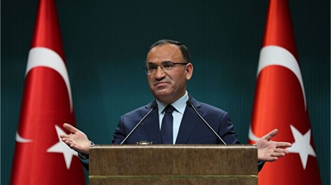
Hükümet Sözcüsü Bekir Bozdağ

Haber Merkezi · 31 Mayıs 2018, 13:42 · Son Güncelleme: 31 Mayıs 2018, 14:22 · Yeni Şafak