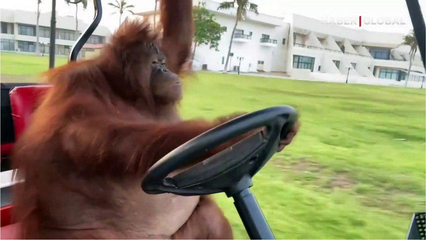
Herkes onu konuştu! Golf arabası süren orangutan sosyal medyayı salladı Sosyal Medya