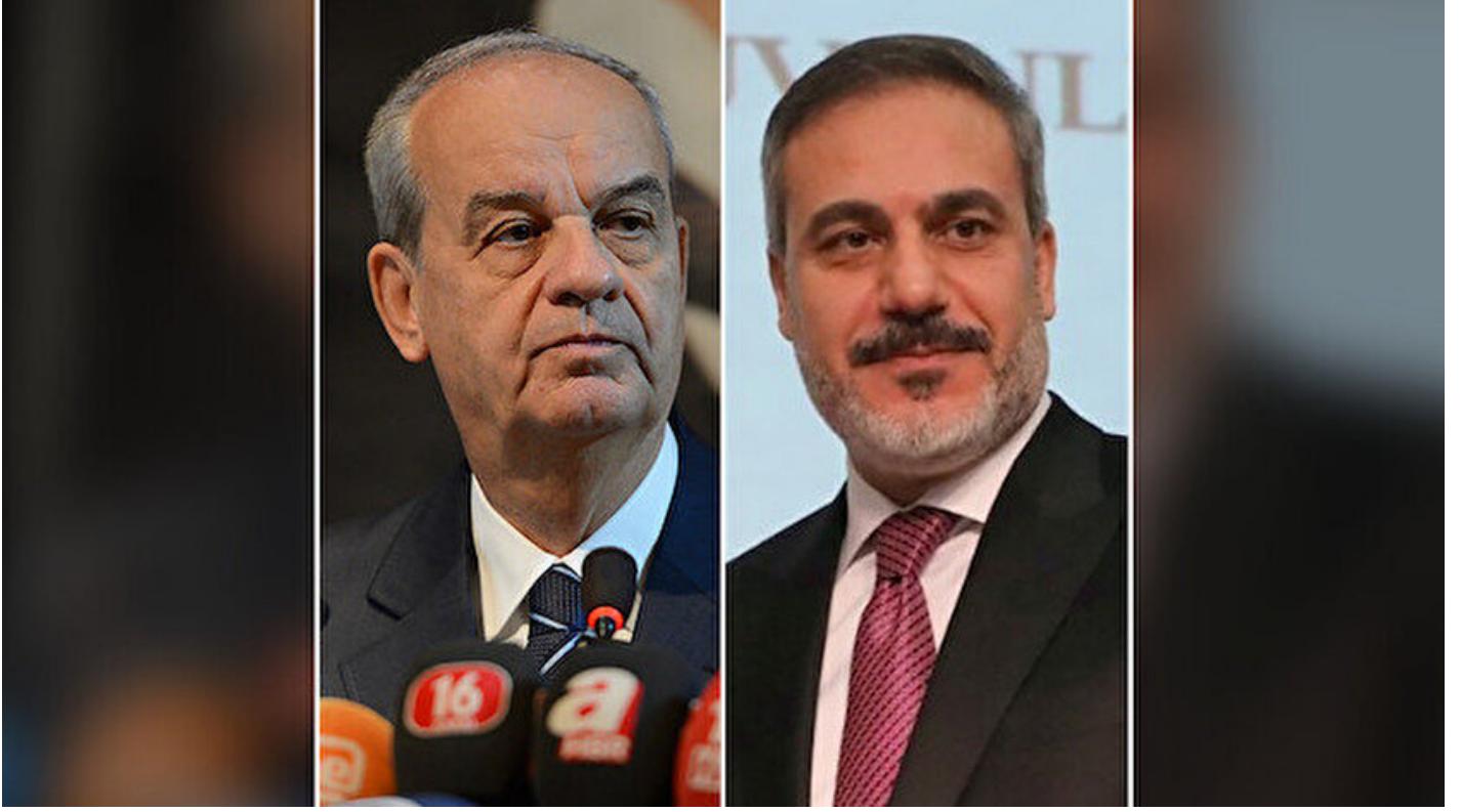
İlker Başbuğu ve Hakan Fidan.