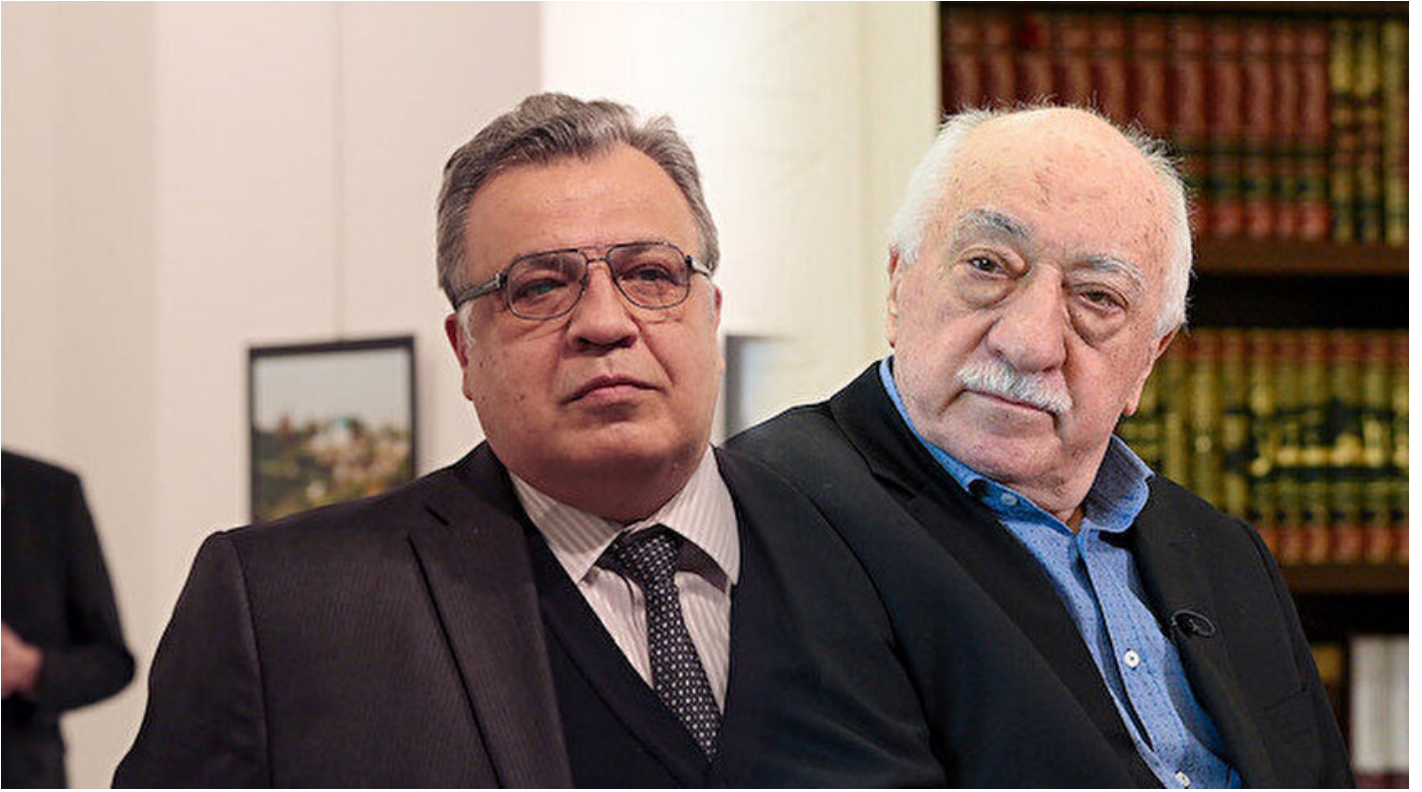
Suikaste uğrayan Rusya'nın Ankara Büyükelçisi Andrey Karlov - FETÖ elebaşı Fethullah Gülen

Haber Merkezi · 23 Kasım 2018, 14:52 · Son Güncelleme: 23 Kasım 2018, 17:06 · AA