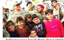
Kahraman paşa İsmail Metin Temel Afrinli çocuklarla birlikte.

AK PARTİ'nin Konya mitinginde CHP'nin adayı Muharrem İnce'yi seri dille eleştiren Cumhurbaşkanı Erdoğan, "Haddini öyle aşıyor ki Metin Paşa'mın apoletlerini sökişip emekli edeceğimi söylüyor. Her şeyden önce o iftar partisi iftar değil esnaf ve zanaatkarlarımızı düzenlediği bir iftardır. Bakınlar ki bize dış geçirmiyorlar, terörlere mücadele kahramanlarımıza saldırmıyorlar. Muharrem İnce, millet sana Metin Temel Paşa'nın apoletlerini sökecek fırsatı hiçbir zaman vermez" dedi.