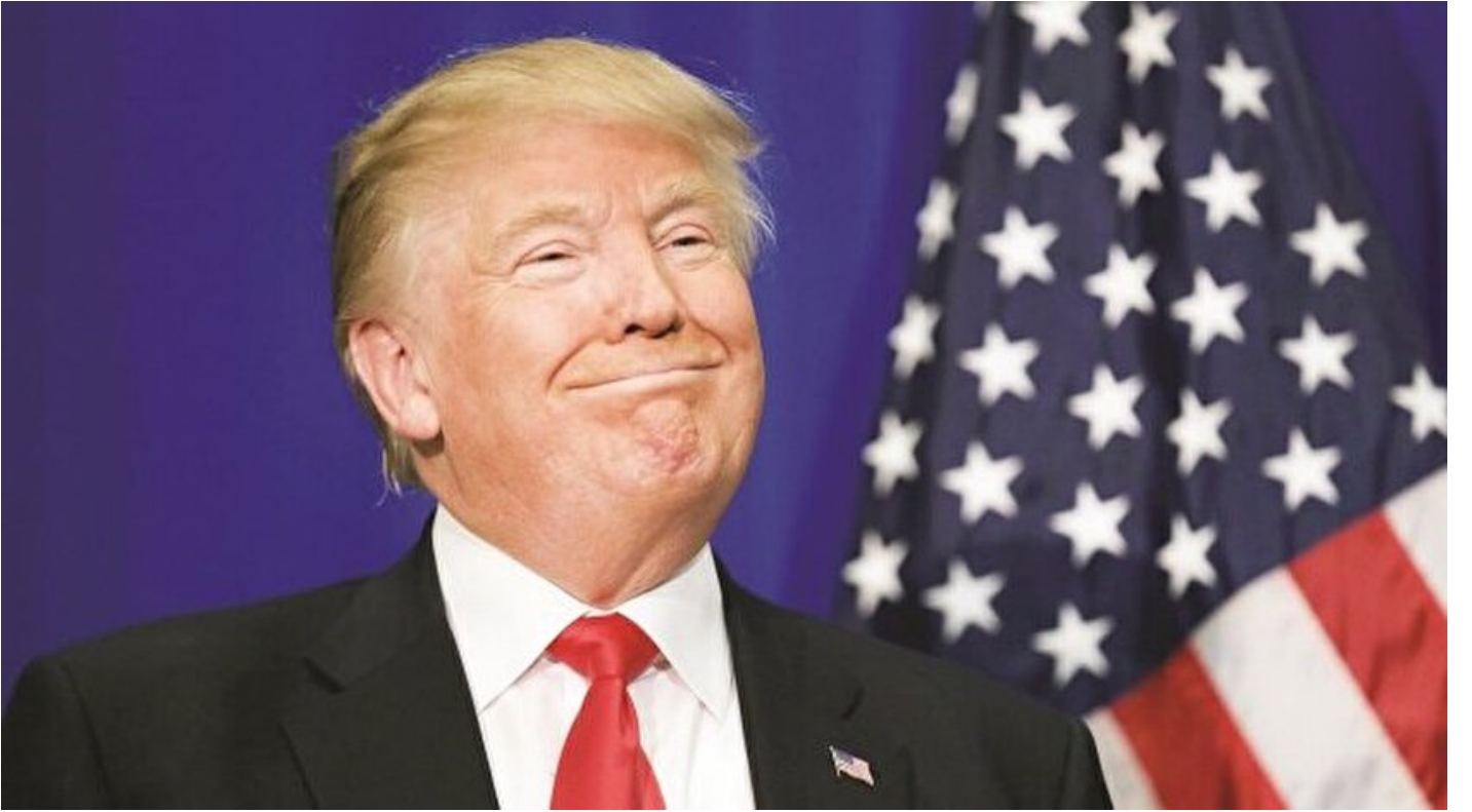
ABD Başkanı Trump

Haber Merkezi · 19 Nisan 2018, 04:00 · Yeni Şafak