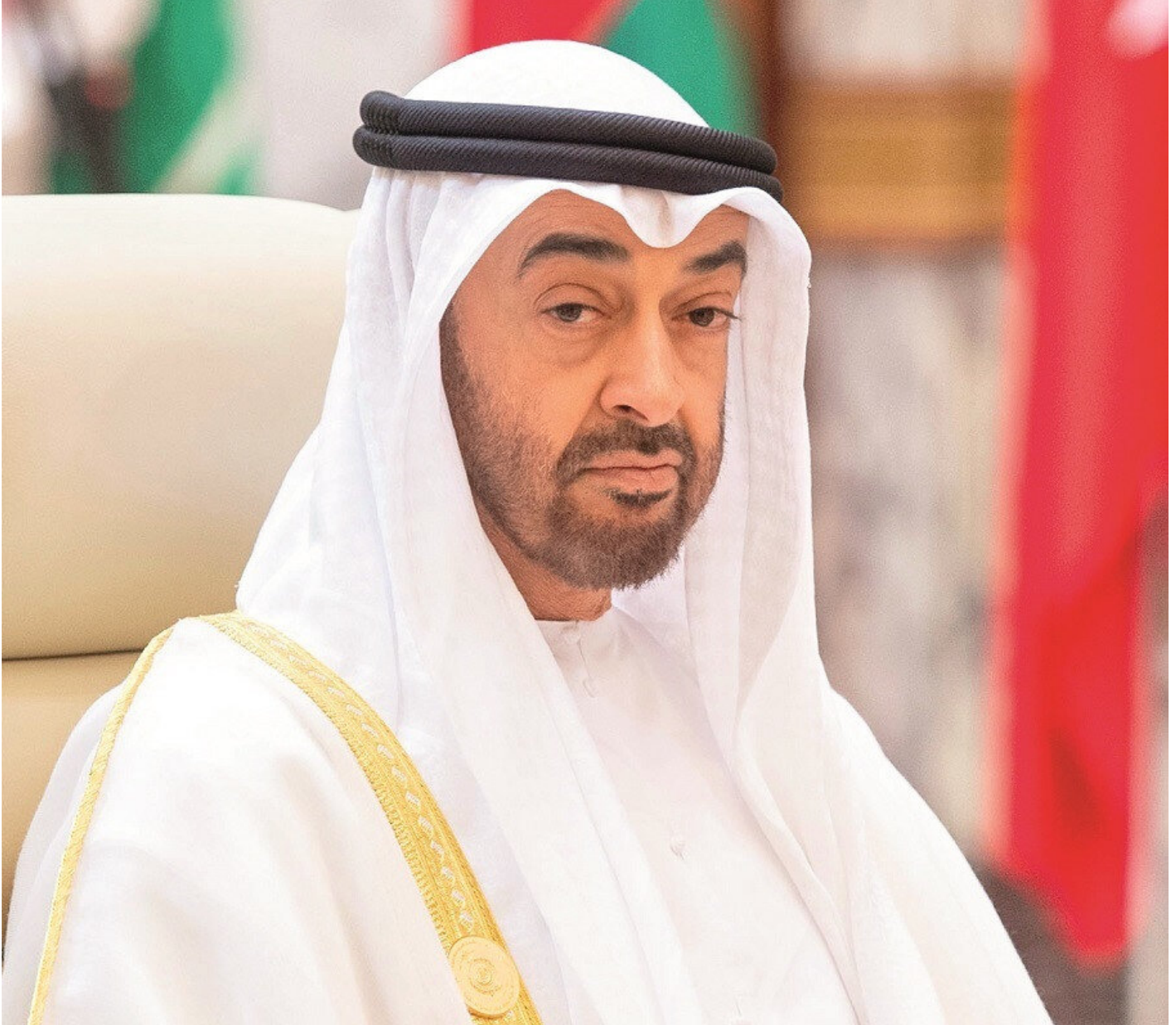
Muhammed bin Zayed

The New ARab internet sitesinin haberine göre, operasyonlar sonucu gözaltına alınan Dahlan'a bağlı yedi üst düzey el-Fetih yetkilisi arasında General Salim Safiyya ve el-Fetih Devrim Yüksek Konseyi üyesi Haytham el-Halabi'nin de bulunduğu belirtildi. Öte yandan Dahlan örgütüne yönelik operasyonların BAE-İsrail "normalleşme" anlaşmasının imzalanmasının hemen ardından başladığı ve düzinelerce kişinin gözaltında olduğu bildirildi. Dahlan örgütünün el-Fetih'te kontrolü ele geçirme girişiminde bulunmaya hazırlandığı öne sürüldü.