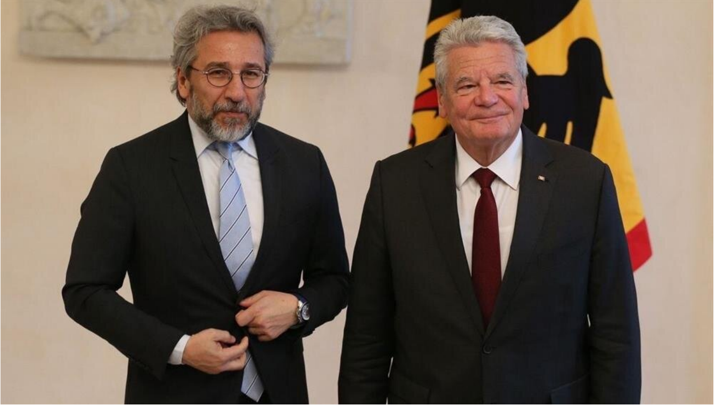
Can Dündar, Almanya Cumhurbaşkanı Gauck'un yanında telaşa kapıldı.

“ Haziran ayında Almanya'ya kaçan Dündar'a geçtiğimiz günlerde Almanya tarafından geçici pasaport da verilmişti.