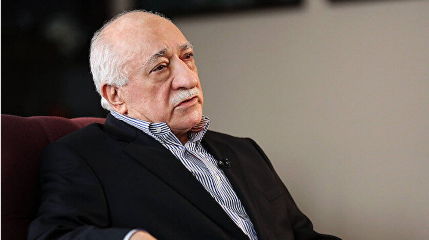
FETÖ elebaşı Gülen

Haber Merkezi • 16 Kasım 2018, 04:00 • Yeni Şafak