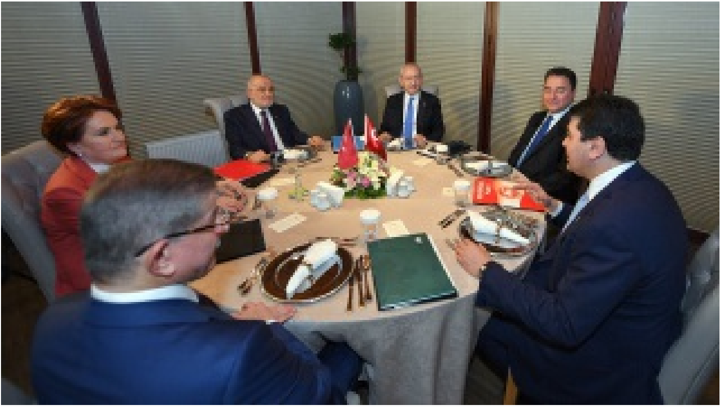
İyi Parti'li Dervişoğlu ile CHP'li Özkan arasında "Defol Git!" tartışması