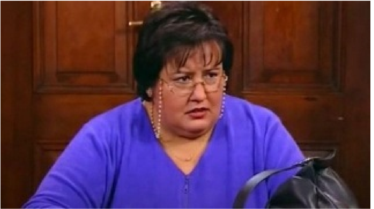
Akrep Nalan hayatını kaybetti