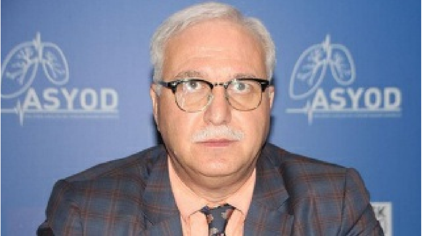
Prof. Özlü: Tam doz aşısızlar risk altında