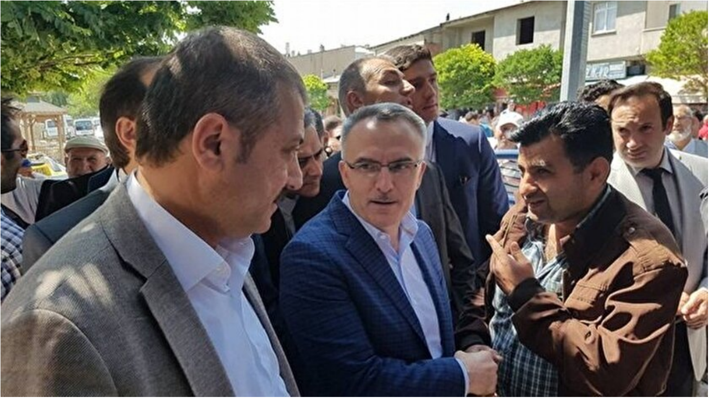
Maliye Bakanı Naci Ağbal

Haber Merkezi · 31 Ağustos 2017, 17:51 · Son Güncelleme: 31 Ağustos 2017, 17:53 · İhlas