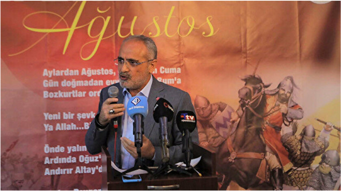
Cumhurbaşkanı Başdanışmanı ve Yerli Düşünce Derneği Onursal Başkanı Yalçın Topçu

Haber Merkezi · 27 Ağustos 2019, 12:07 · Son Güncelleme: 27 Ağustos 2019, 14:09 · Yeni Şafak