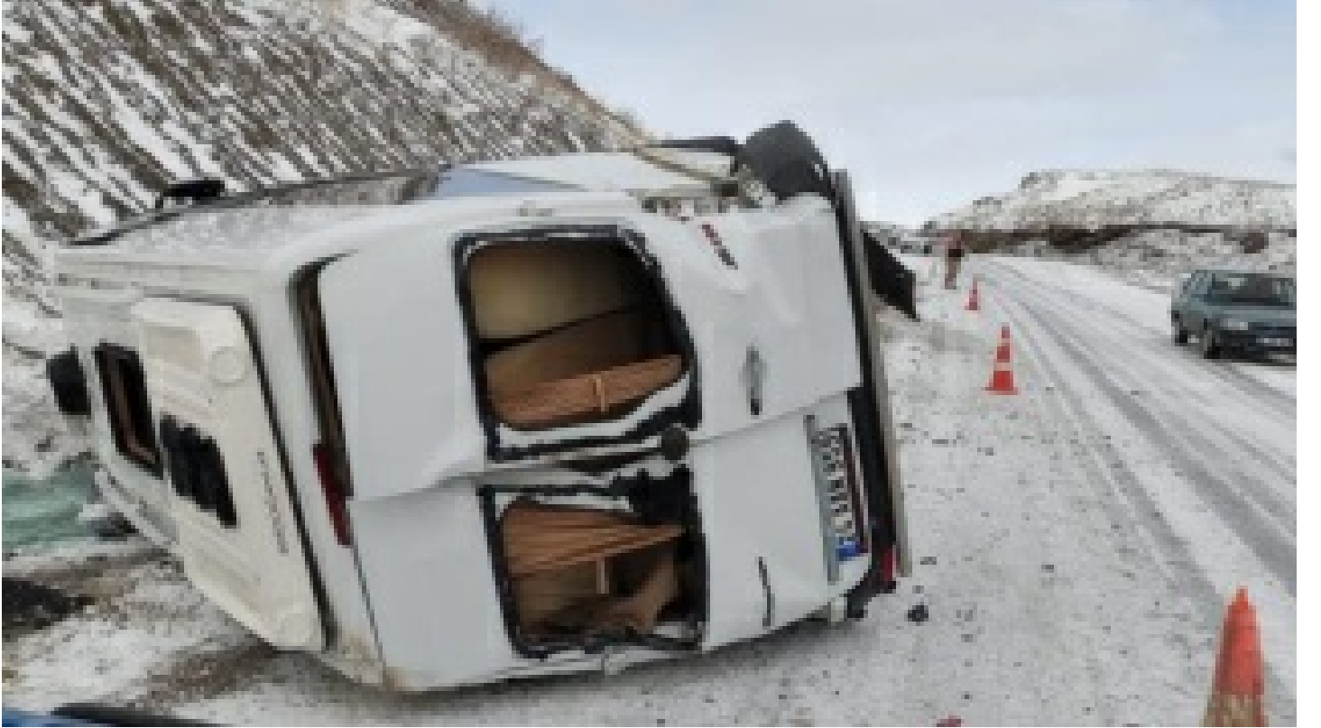
Erzincan'da devrilen minibüsteki 8 kişi yaralandı