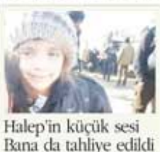
Halep'in küçük sesi Bana da tahliye edildi

Perşembe ve cuma günü Halep'ten sivil ve yaralılar tahliye etmek için giden otobüslere saldırılmasıyla duran operasyon yeniden başladı