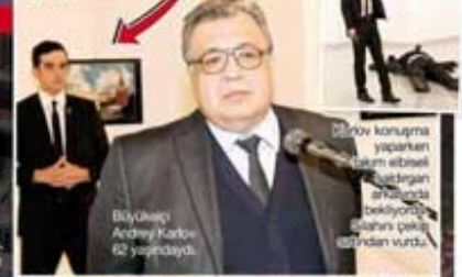
Büyükelçi Andrey Karlov 62 yaşındaydı.

Ölüm konuşma yaparken arkasından vuruldu. Silah sesi duyuldu. Bekleyen polis saldırganı peşinden vurdu.