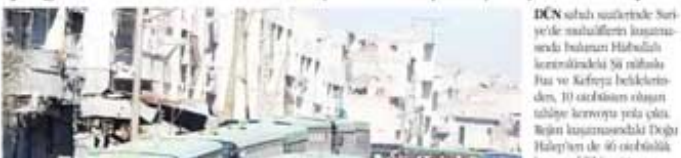
DCN saldırı saldırılarında Suriye'de mahalliyeleri korumak amacıyla bulunan Hizbullah teröristlerinde 50 mihnebu İsa ve Kafreya birliklerinden, 10 otobüsün oğlan tahliye kervanına yola çıktı. Rejim korumasındaki Doğu Halep'ten de 46 otobüslük

Perşembe ve cuma günü Halep'ten sivil ve yaralılar tahliye etmek için giden otobüslere saldırılmasıyla duran operasyon yeniden başladı