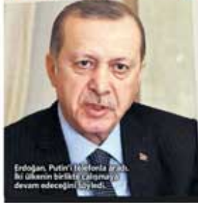
Erdoğan, Putin'i telefonla aradı. Hiç konuşan belediye (Zaman) ile devam edeceği bildirildi.