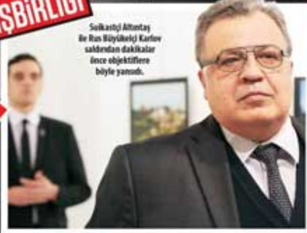
Suikastçı Altıntaş ile Rus Büyükelçi Karlov saldırıdan dakikalar önce objektiflere böyle yanadı.

Peki neden FETÖ'ye terörle mücadele amaçlı yapılan saldırılara saldırı yapıldı?