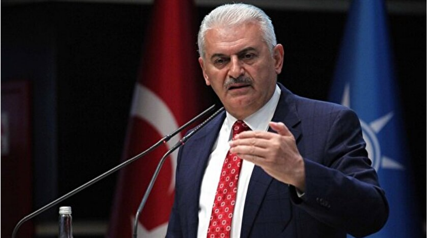
Başbakan Binali Yıldırım.

Haber Merkezi · 14 Ekim 2017, 14:38 · Son Güncelleme: 14 Ekim 2017, 15:17 · Yeni Şafak