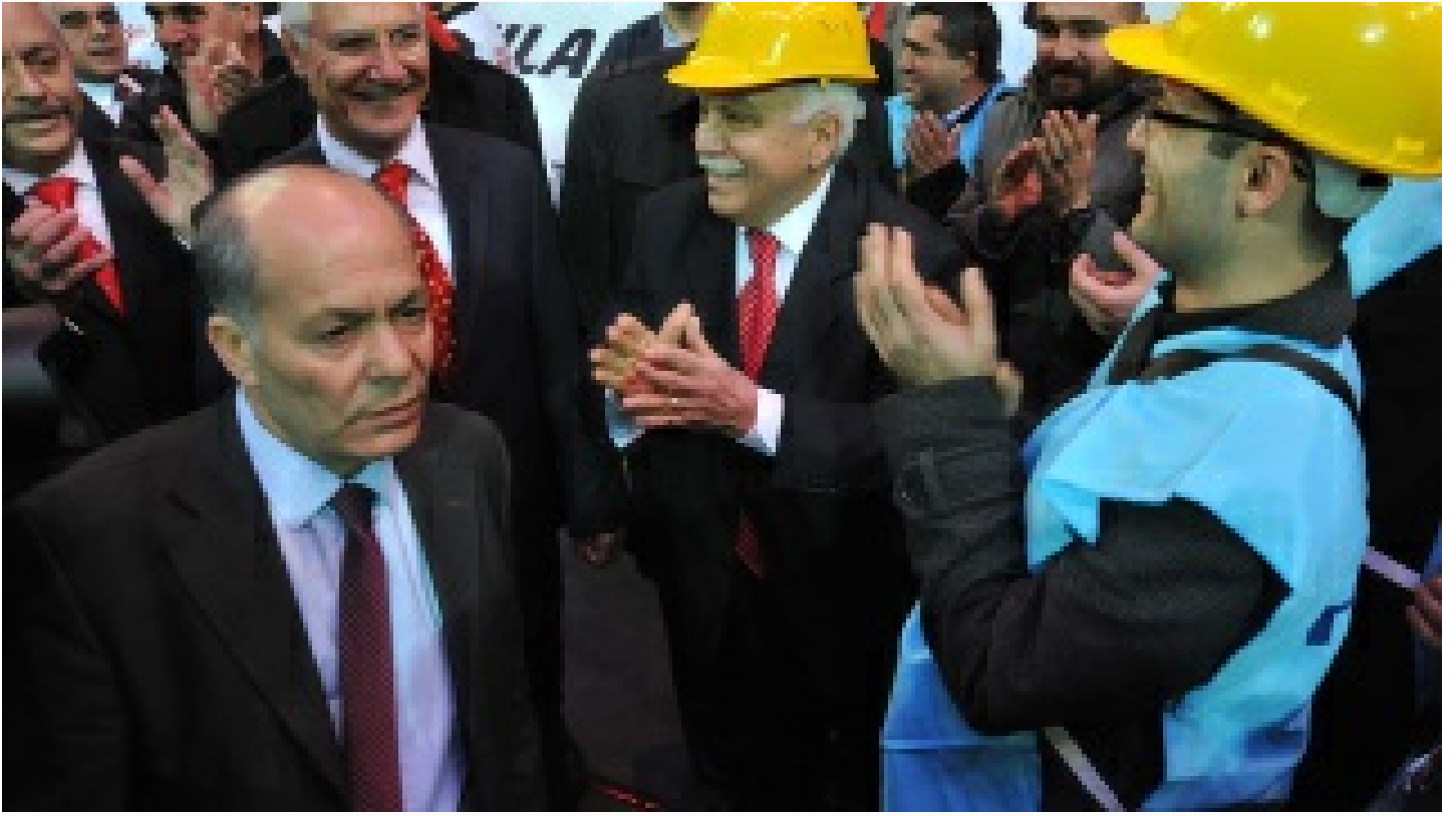
'Sonsuz Nöbetçi'yi arkadaşları anlattı: Parti'nin vicdanı ve neşesiydi