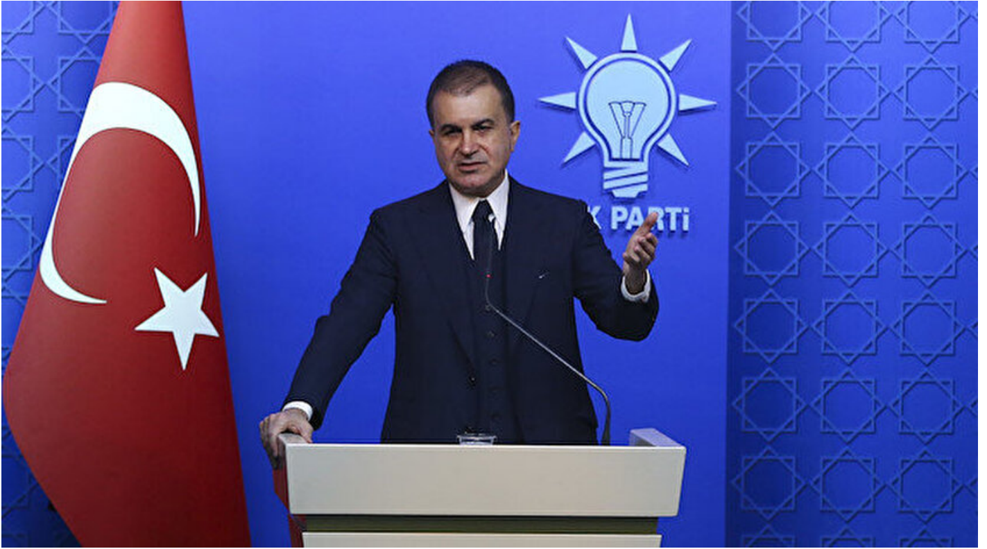
AK Parti Sözcüsü Ömer Çelik