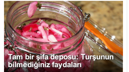
Tam bir şifa deposu: Turşunun bilmediğiniz faydaları