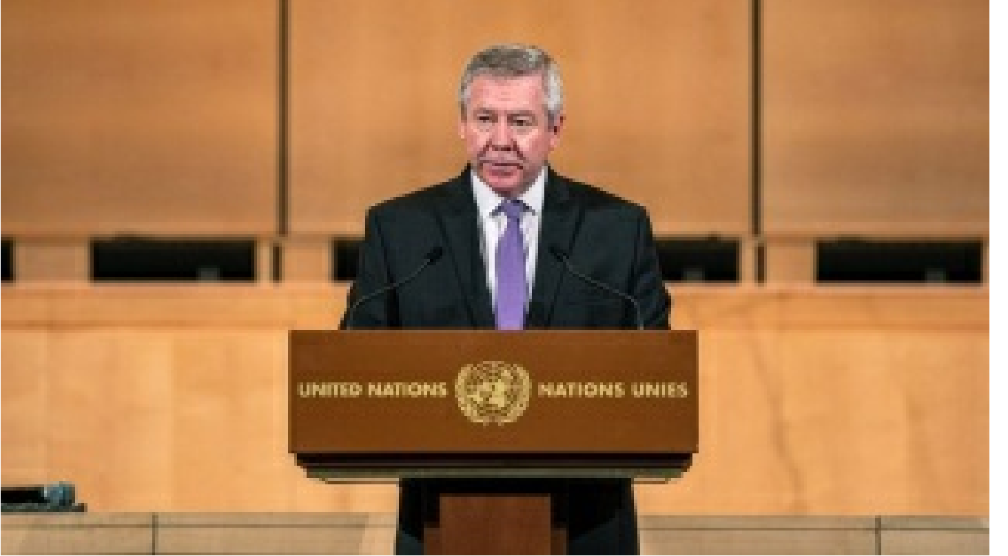
Rusya'dan, Türkiye'nin 'müzakere' teklifine olumlu yanıt