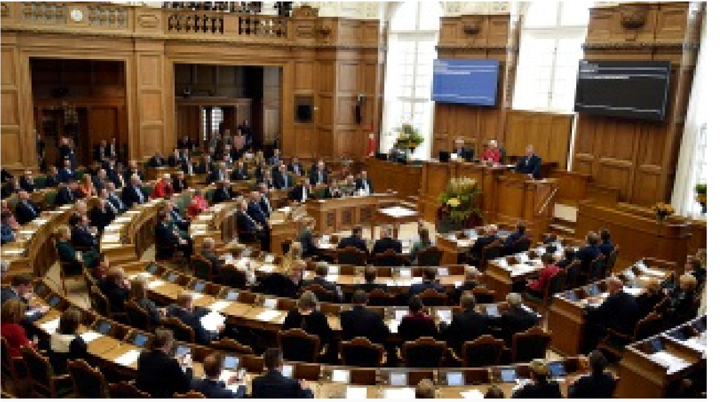
Danimarka Suriyelilere uyguladığı mücevhher yavasını Ukraynalılara uygulamayacak