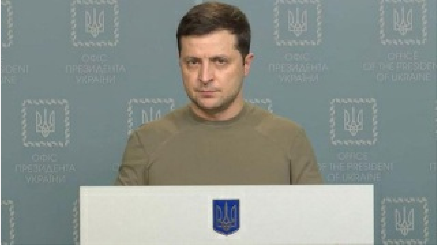
"Zelenskiy ABD'nin Varşova Büyükelçiliği'nde"