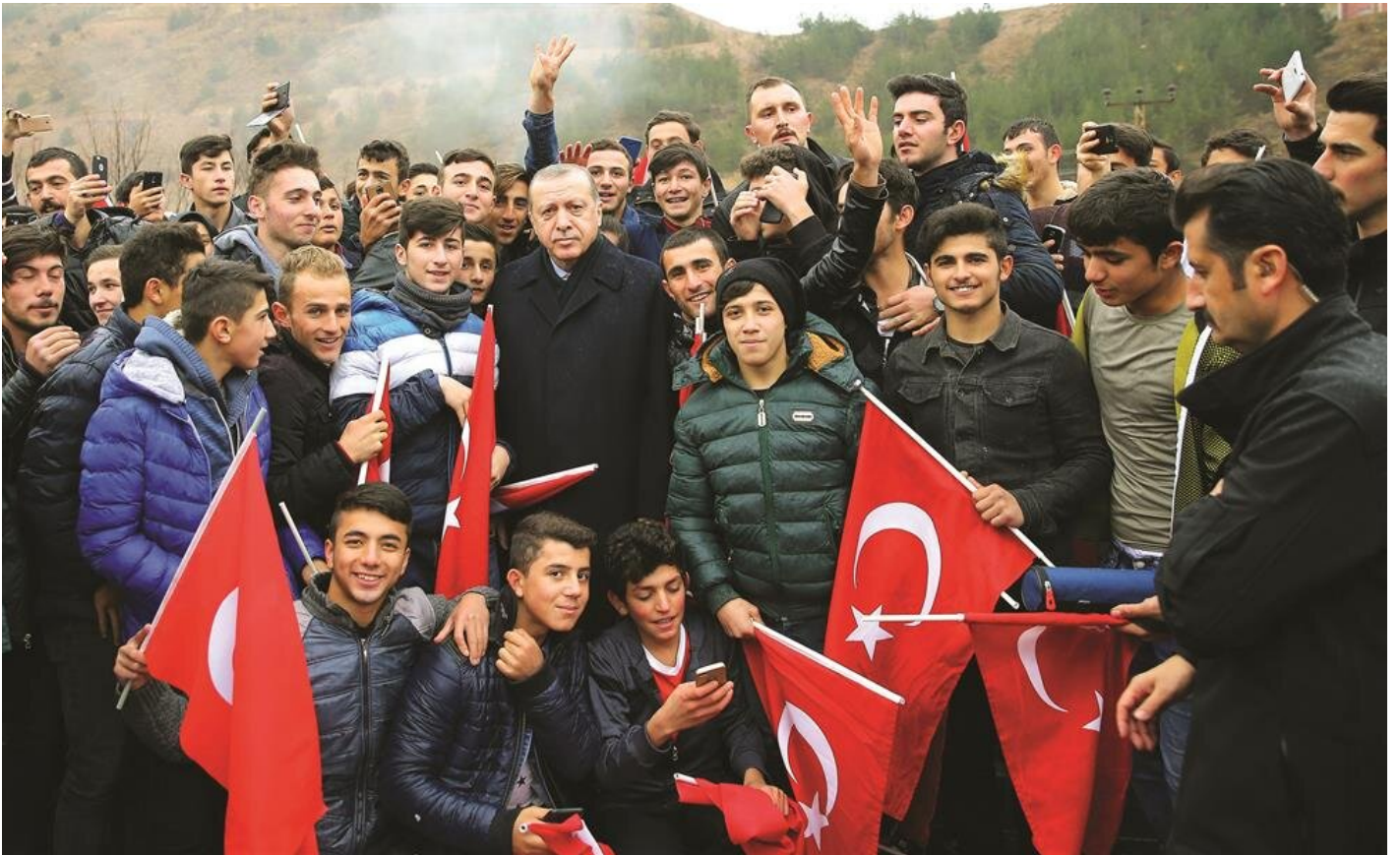
Cumhurbaşkanı Erdoğan nGümüşhane'de gençlerle sohbet edip fotoğraf çekti.

Biz değişim dedikçe, söylemlerimizi, kadrolarımızı yeniledikçe adeta birilerinin uykusu kaçıyor. Genel başkan değişikliğini dahi kasetle, türlü ayak oyunları ile yapabilenler, AK Parti'nin bütün bu süreçleri şeffaf bir şekilde yürütmesinden rahatsızlık duyuyorlar. Koltuğa oturduğu günden beri girdiği tüm seçimleri kaybetmiş bir zat, kendi başarısızlıklarının bedelini ödemeyi aklına dahi getirmemiş olmasına rağmen AK Parti'ye dil uzatma hadsizliği gösteriyor.