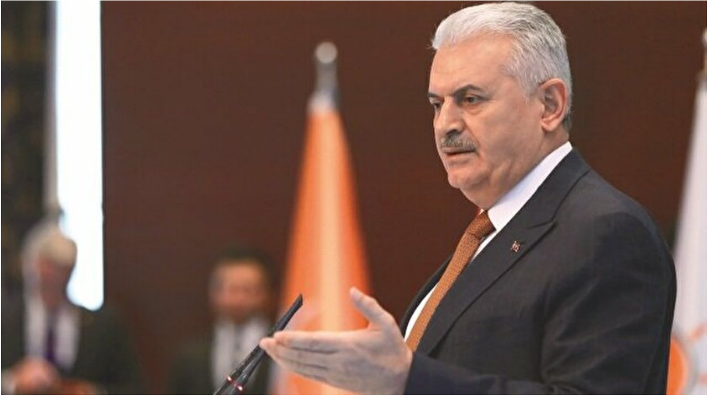
Başbakan Binali Yıldırım