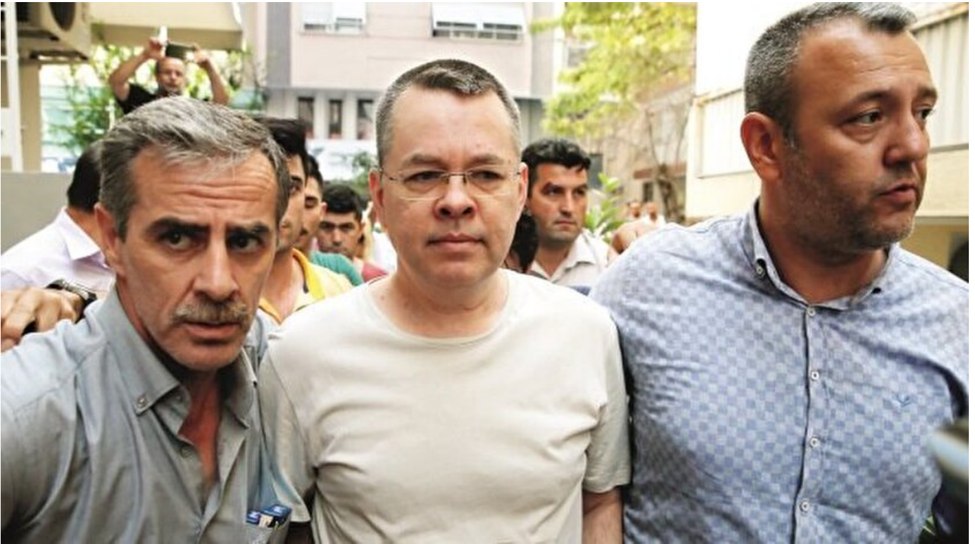
Papaz Andrew Craig Brunson

Haber Merkezi · 28 Temmuz 2018, 04:00 · Yeni Şafak