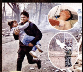
Yunanistan polislerin ve sınır birliklerinin müdahalesiyle 130 çocuğun Yunanistan'a getirildi. Çoğu mermilerle saldırmaması sonucu 1 mülteci hayatını kaybederken, 5 maslum yaralandı. Sınır geçen mülteci sayısı ise 133 bini aştı.