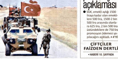
Mehmetçik katil Esed'e bağlı askerleri karadan ve havadan vurmaya devam ediyor.

● Millî Savunma Bakanlığı, Barış Pınarı Harekati'nin başlangıcından bu yana 3 bin 138 rejim askerin öldürüldüğünü, 3 uçak, 8 helikopter, 3 İHA, 151 tank, 47 top/obüs, 52 ÇN-RA ve 8 hava savunma füze sisteminin de imha edildiğini bildirdi. ● HABERİ 7'DE