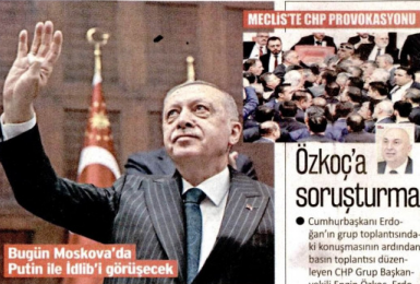
Partisinin grup toplantısında konuşan AK Parti Genel Başkanı ve Cumhurbaşkanı Recep Tayyip Erdoğan, Rusya Devlet Başkanı Vladimir Putin ile bugün yapacakları görüşmeden beklentisine ilişkin olarak, "Her şeyi açık. Beklentimiz ateklesin sağlanmas" açıklamasında bulundu.

● Türkiye'nin Suriye'de verdiği mücadeleyi karamalama çalışan ihbarlara da seslenen Başkan Erdoğan, "Verdiğimiz mücadelede hem sahada zafere yürüyeceğiz hem de bu müstevli destekçilerini milli irade ayakları altında ezerek ülkemizi hedeflerine ulaştıracağız. Türkiye'nin bu tarihi mücadelesini fitneye, iftiraya lekelenmeye çalışan kim olursa olsun, hayırsızdır, şerefsizdir, alçaktır, haindir" diye konuştu. ● 9'DA