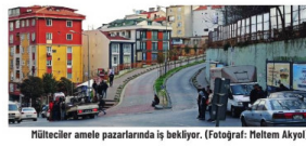
Mülteciler emek pazarlarında iş bekliyor.