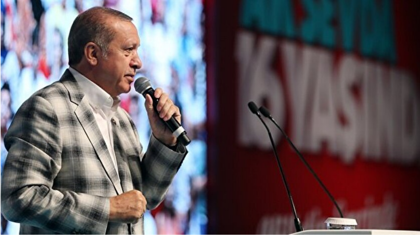
Cumhurbaşkanı Recep Tayyip Erdoğan.

Haber Merkezi · 13 Ağustos 2017, 17:02 · Son Güncelleme: 13 Ağustos 2017, 17:47 · Yeni Şafak