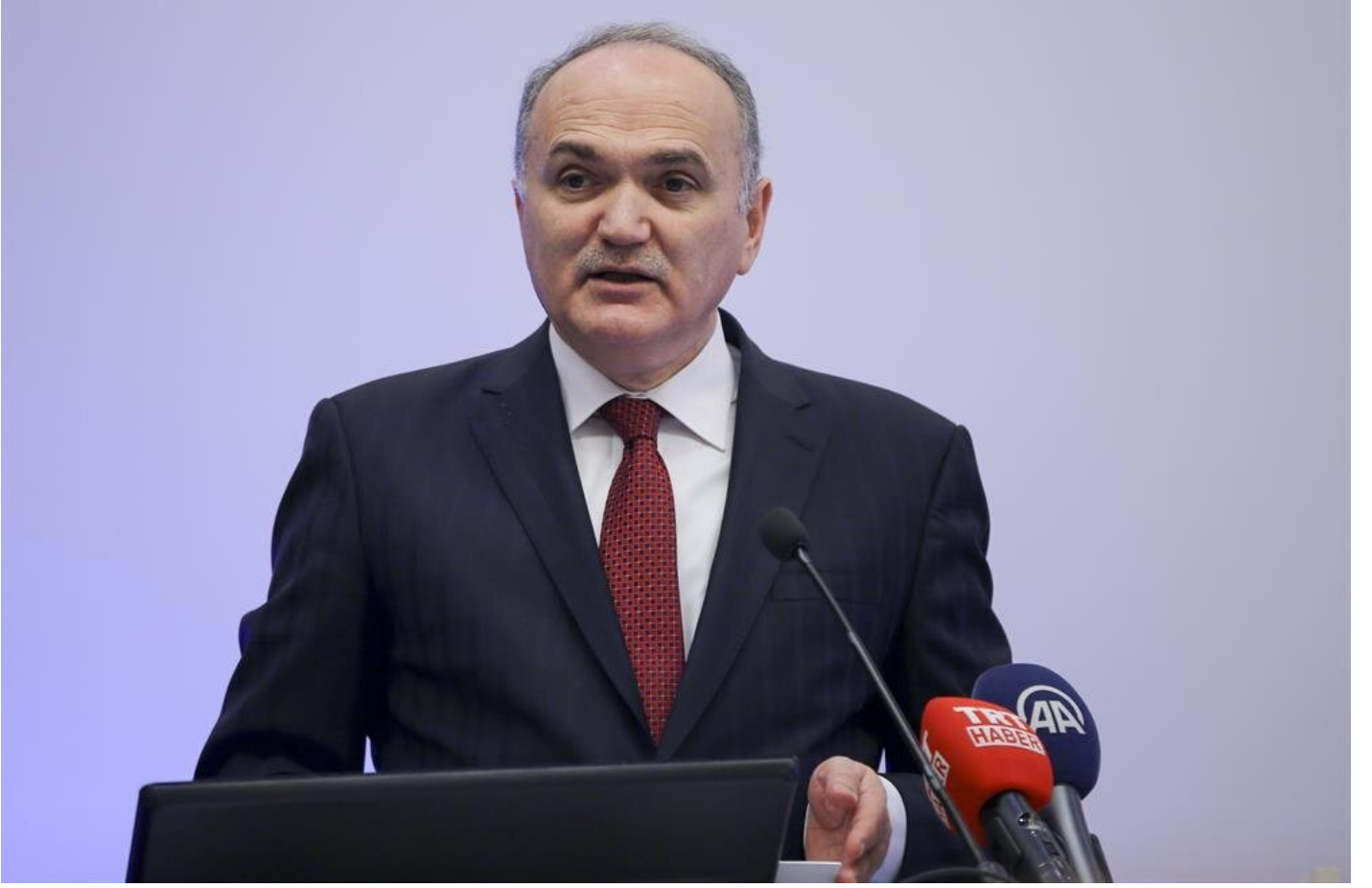
Bilim, Sanayi ve Teknoloji Bakanı Faruk Özlü

Muharrem İnce'nin öğretmen kökenli olduğunu ama dersine çalışmadan konuştuğunu söyleyen Özlü, "Biz akıllı sürüş sistemleri ve elektrikli bir otomobil yapıyoruz, yapmak için gayret sarf ediyoruz. Bu, 30 yıl öncesinin teknolojisi değil, 30 yıl sonrasının teknolojisidir. Yerli marka otomobil, Türkiye'nin teknoloji dönüşüm projesidir. Dolayısıyla Muharrem bey, hem dersine çalışmıyor hem de sormuyor. Bize 'Nasıl bir şey yapıyorsunuz?' diye sorsa ya da bize güvenmiyorsa 5 ana yüklenici adayı var, onlardan herhangi birine sorsa bunun bir kaporta işi olmadığını, bunun yüzde 70'lere varan oranlarda bir elektronik donanım ve yazılım ürünü olduğunu bilir. Muharrem bey karnından konuşuyor, kusura bakmasın. Okumuyor, sormuyor, incelemiyor." ifadelerini kullandı.