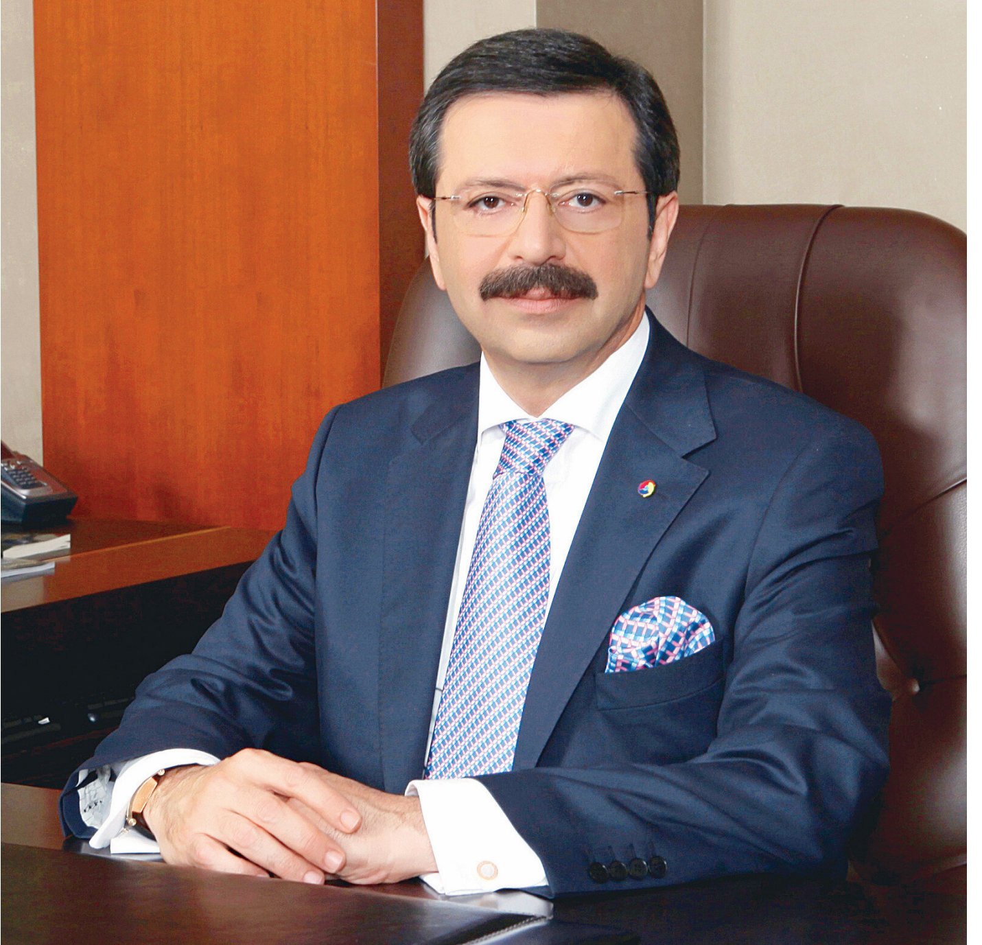
Türkiye Odalar ve Borsalar Birliği (TOBB) Başkanı Rifat Hisarcıklıođlu

* Türkiye Odalar ve Borsalar Birliği (TOBB) Başkanı Rifat Hisarcıklıođlu, 15 Temmuz darbe girişiminin hem Türkiye siyaseti, hem de Türkiye ekonomisi için tarihi bir stres testi olduğunu ve milletin dirayetiyle bu testin başarıyla geçildiğini belirtti. Hisarcıklıođlu, Mustafa Kemal Atatürk'ün "Hâkimiyet, kayıtsız şartsız milletindir" ilkesini şiar edinen TOBB ve oda borsa camiası olarak demokrasiyi savunmaya devam edeceklerini vurguladı.