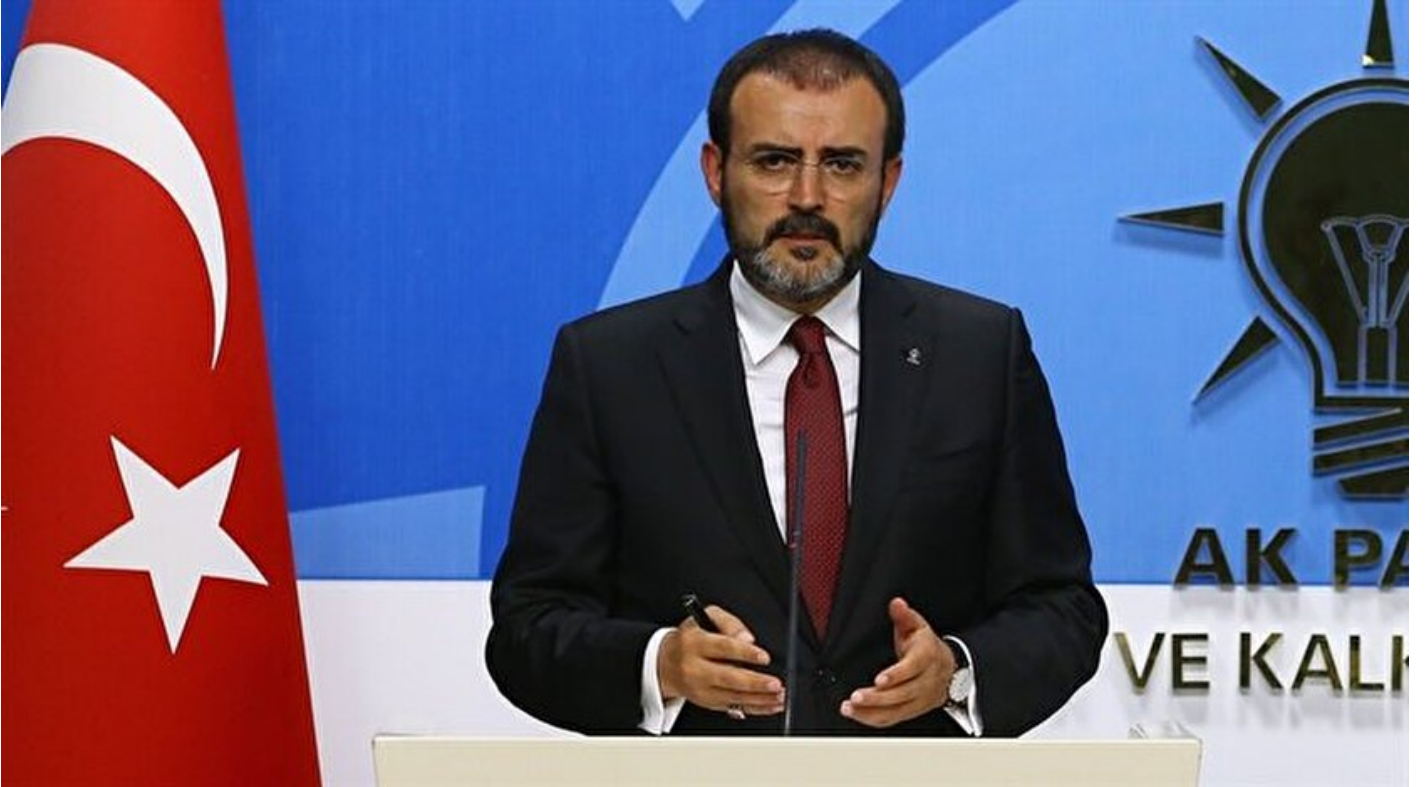
AK Parti Sözcüsü Mahir Ünal.

Haber Merkezi · 30 Haziran 2017, 17:10 · Son Güncelleme: 30 Haziran 2017, 21:35 · AA