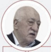
FETULLAH GÜLEN Fetullahçı Terör Örgütü elebaşı

Yargıtay 16. Ceza Dairesi, bugüne kadar verdiği kararlarla örgüt üyeliği kavramını ve verilecek cezaların ayrıntılarını belirledi. Örgütün dikey yapılanmayla, 7 katlı piramidin katmanları şeklinde çalıştığı tespit edildi