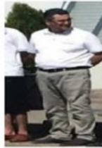
4 NOLU FOTOĞRAF