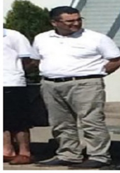
4 NOLU FOTOĞRAF