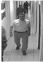
3 NOLU FOTOĞRAF

1 nolu fotoğrafta gösterilen 143 filo koridor güvenlik kamerası CH7 2016-07-16-03-33-03 serinolu görüntüsün 03.22.11 ile 03.22.23 zaman aralığındaki görüntüsünde koridor içerisinde görülen şahıs ile 2 nolu fotoğrafta Olay Yeri İnceleme Şube Müdürlüğünde çekilen fotoğraflar arasında benzerlikler görülen şahıs;