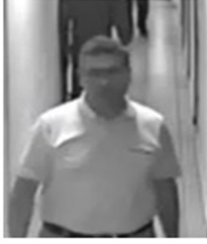
1 NOLU FOTOĞRAF