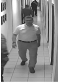
3 NOLU FOTOĞRAF

1 nolu fotoğrafta gösterilen 143 filo koridor güvenlik kamerası CH7 2016-07-16-03-33-03 serinolu görüntünün 03.22.11 ile 03.22.23 zaman aralığındaki görüntüsünde koridor içerisinde görülen şahıs ile 2 nolu fotoğrafta Olay Yeri İnceleme Şube Müdürlüğünde çekilen fotoğraflar arasında benzerlikler görülen şahıs;