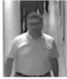
1 NOLU FOTOĞRAF

01.04.2017 - 11:27 | Son Güncelleme : 02.04.2017 - 18:31