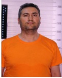
2 NOLU FOTOĞRAF

1 nolu fotoğrafta gösterilen 143 filo koridor güvenlik kamerası CH7 2016-07-16-03-33-03 serinolu görüntünün 03.22.11 ile 03.22.23 zaman aralığındaki görüntüsünde koridor içerisinde görülen şahıs ile 2 nolu fotoğrafta Olay Yeri İnceleme Şube Müdürlüğünde çekilen fotoğraflar arasında benzerlikler görülen şahıs;