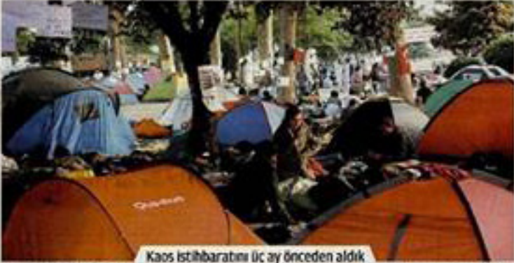
Kaos istihbaratını üç ay önceden aldık

İstiharatın sadece işsizlik değil, aynı zamanda sosyal adalet, eğitim ve sağlıkla ilgili konularla da ilgili olduğunu belirtti. Erdoğan, toplantıda "İstiharatın sadece işsizlik değil, aynı zamanda sosyal adalet, eğitim ve sağlıkla ilgili konularla da ilgili olduğunu" belirtti.