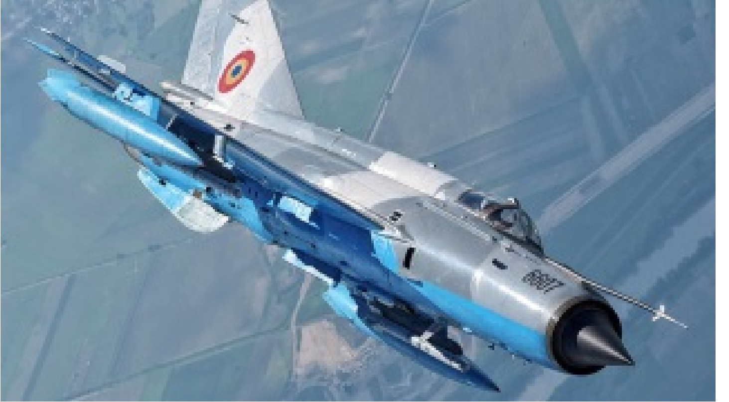
Önce uçak sonra helikopter ardından gemi