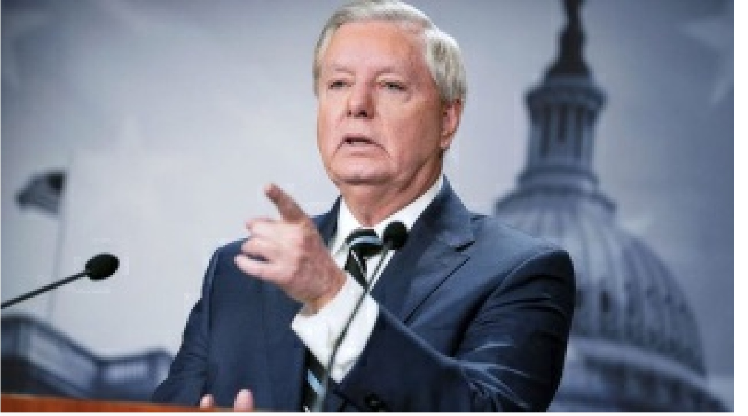
ABD'li senatörün hayali 'Putin'e suikast'