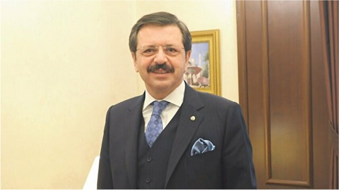
Türkiye Odalar ve Borsalar Birliği (TOBB) Başkanı Rifat Hisarcıkloğlu