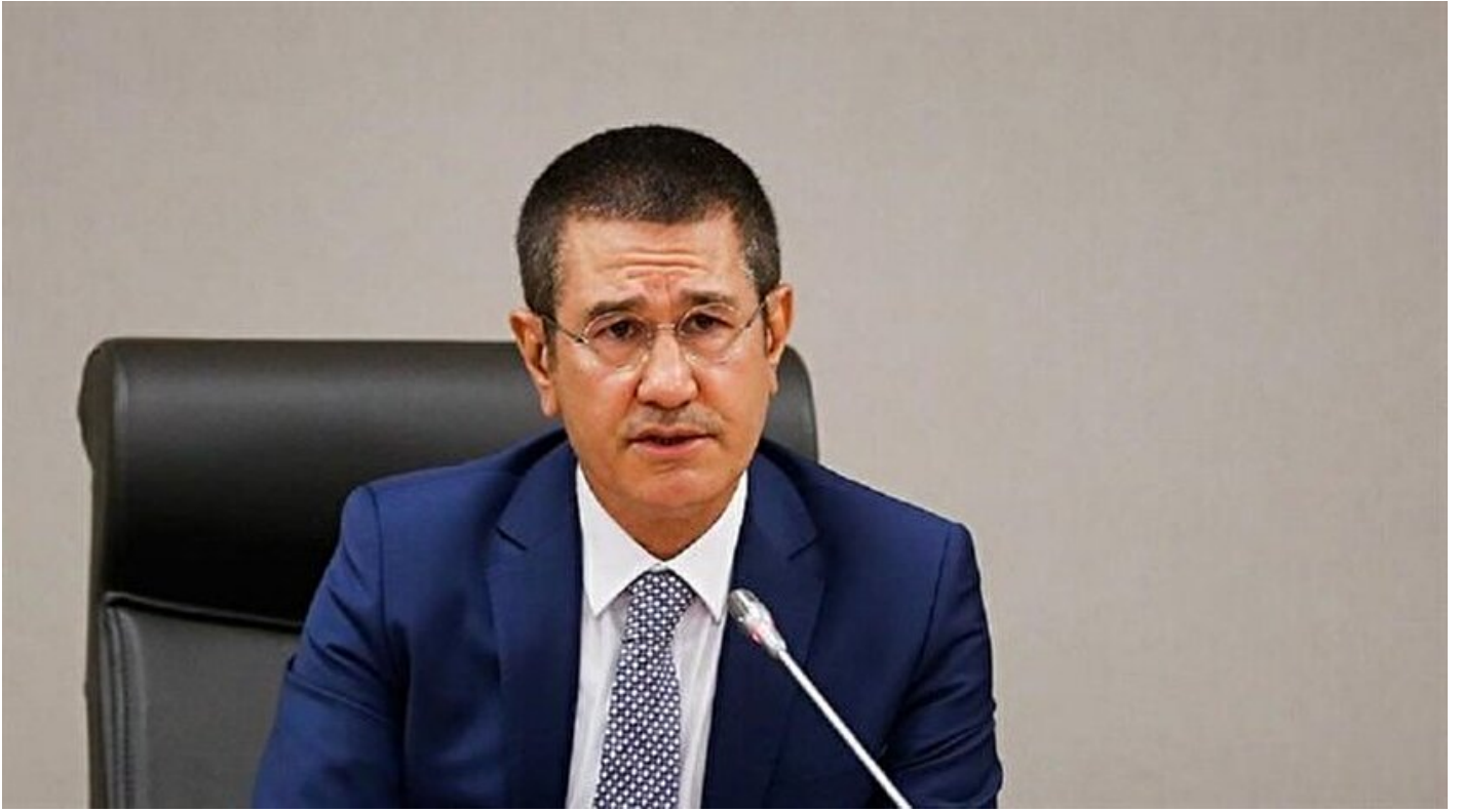
Başbakan Yardımcısı Nurettin Canikli

Haber Merkezi · 01 Aralık 2016, 08:54 · Son Güncelleme: 01 Aralık 2016, 09:13 · AA