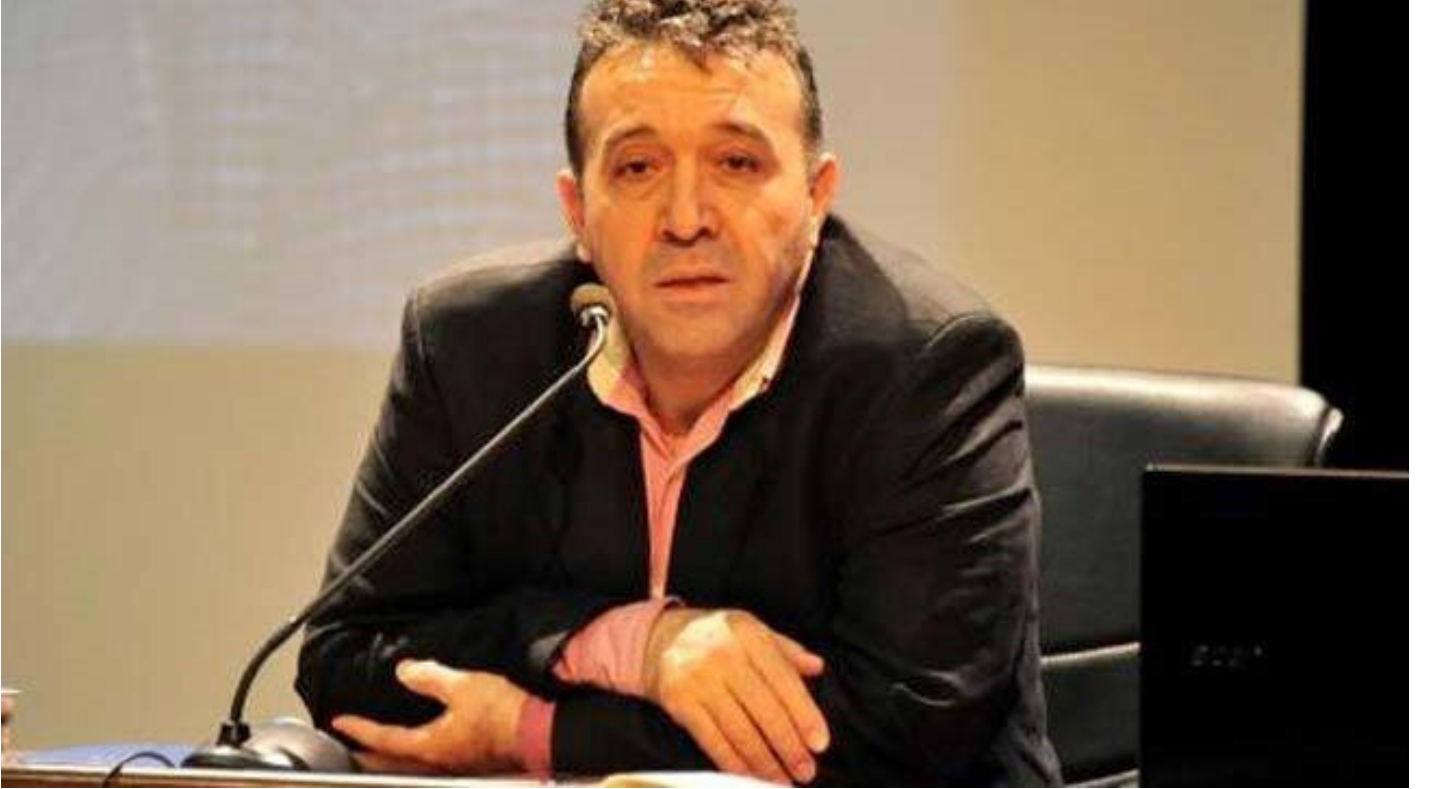
Terör ve Güvenlik Uzmanı Abdullah Ağar

Hedefinin üzerine ateş ettikten sonra, 'canlı-cansız' ayrımını çok rahat bir şekilde yapabildiğini görüyoruz. Aynı zamanda hedef tespiti, hedefini seçimi ve seçtiği hedefi etkisizleştirme noktasında olukça yetkin bir terörist var karşımızda.