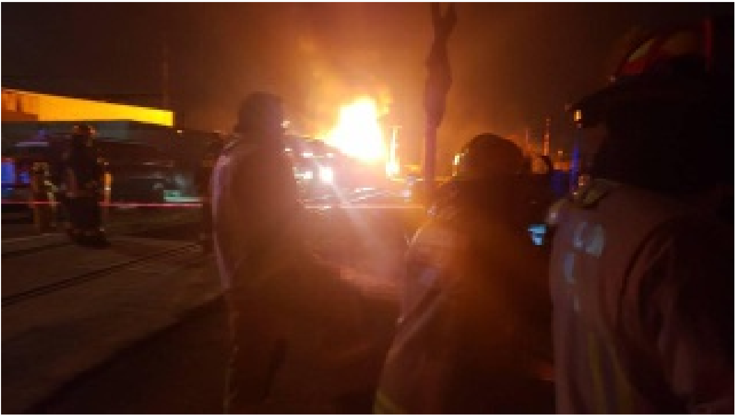
Dolmabahçe Sarayı'nda yangın!