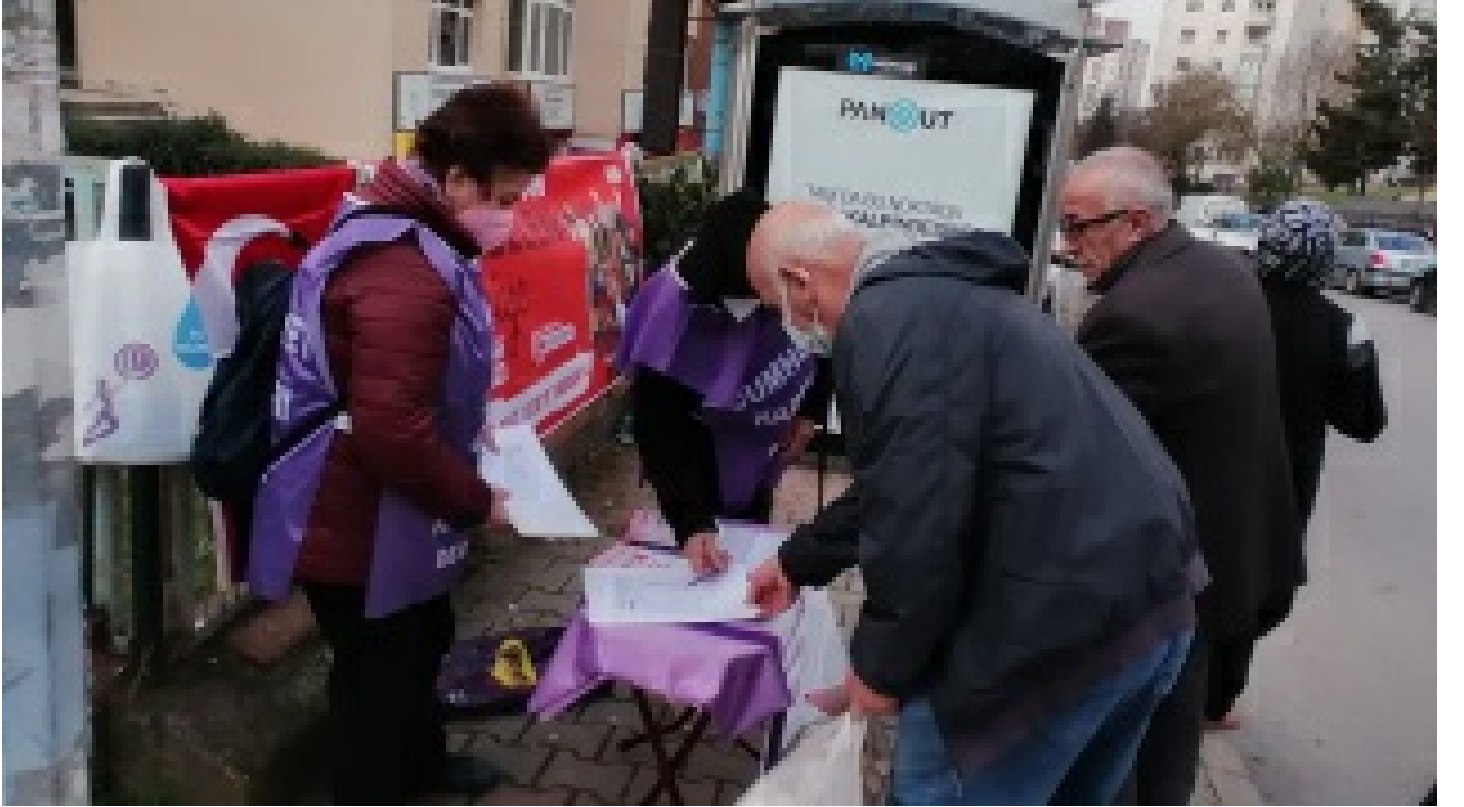
6 Mart'ta Tandoğan'da buluşuyoruz! Üretici kadınlar en önde