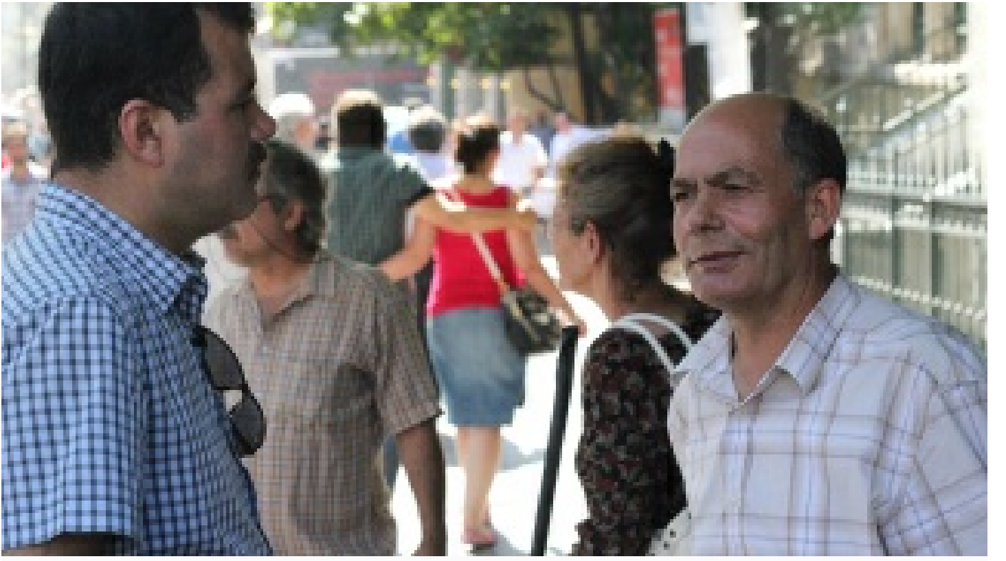
İliğine işlemiş cesaret erdemi... Onun için zor değil olağandı