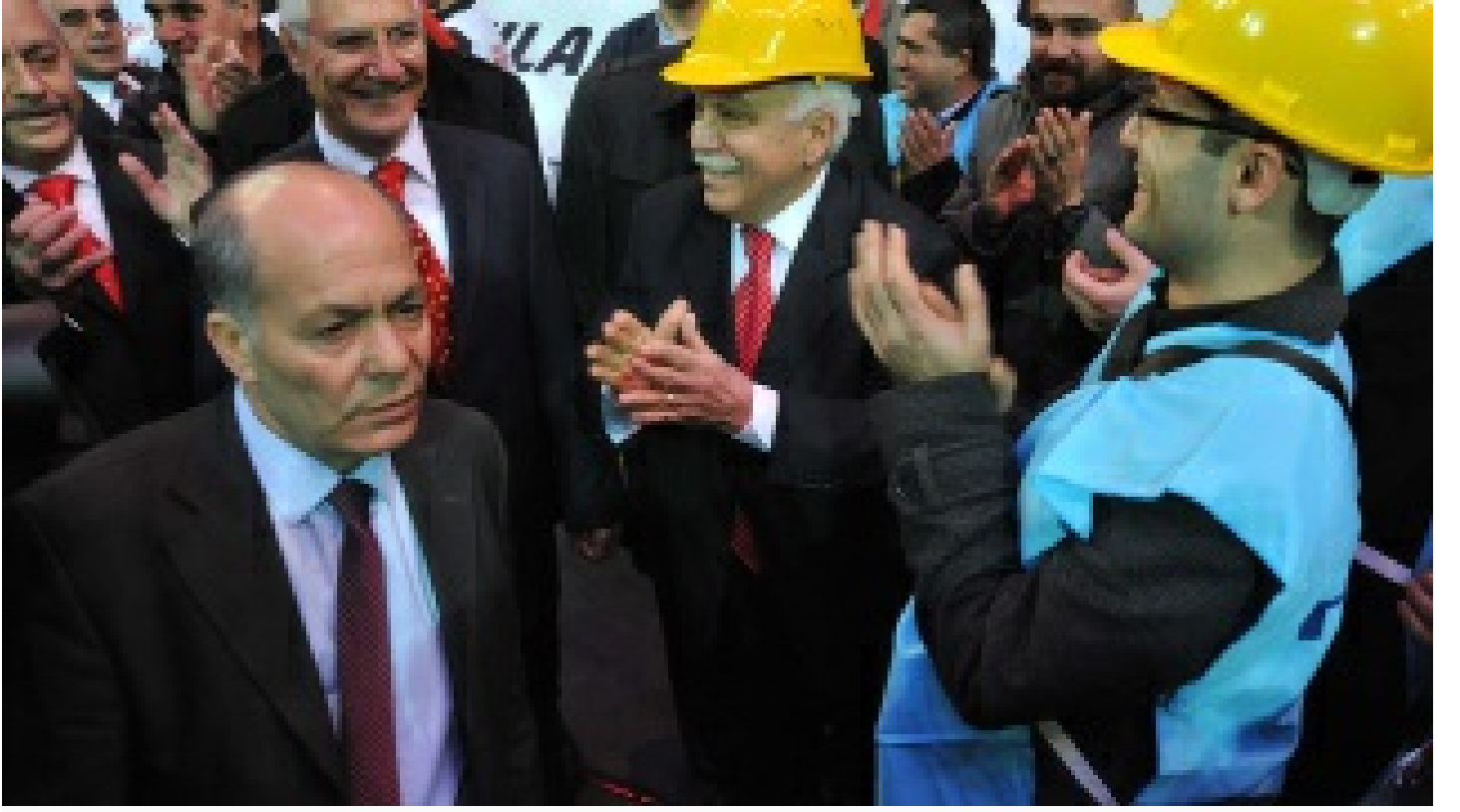
'Sonsuz Nöbetçi'yi arkadaşları anlattı: Parti'nin vicdanı ve neşesiydi