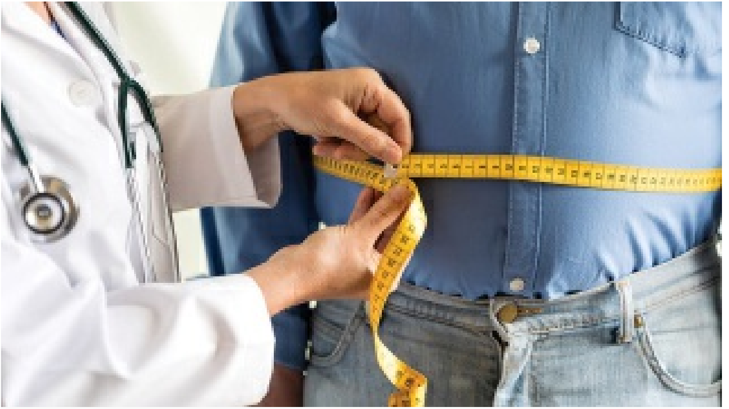
Kovid-19 salgını obeziteyi de artıracak