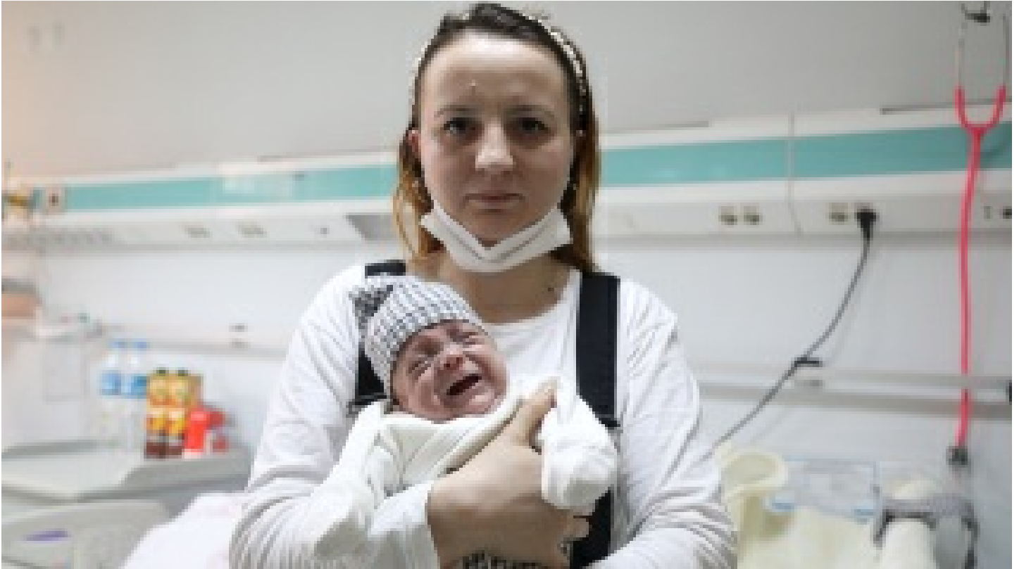
Hayata 600 gramla başladı