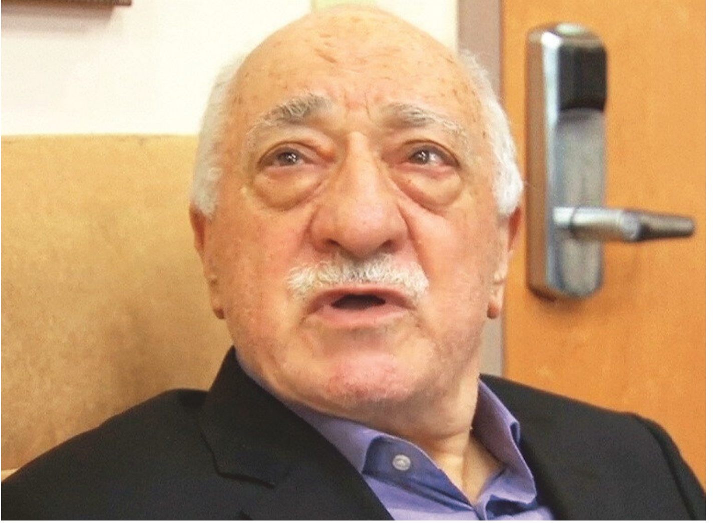
Teröristbaşı Fetullah Gülen

...den örgüt hakkında bir rapor hazırlanmış, raporda Gülen ve örgütün yapıldığı bazı ayrıntılarıyla ortaya koyuldu. Yöneticileri, iç sorumluları ve örgütün Mossad ve Masonlarla irtibatı raporda tek tek zikredildi. Raporda, mason Gülen'in dışında 20 üst düzey yöneticinin isim listeleri verildi ve bu kişilerin 14'ünün mason olduğu belirtildi.