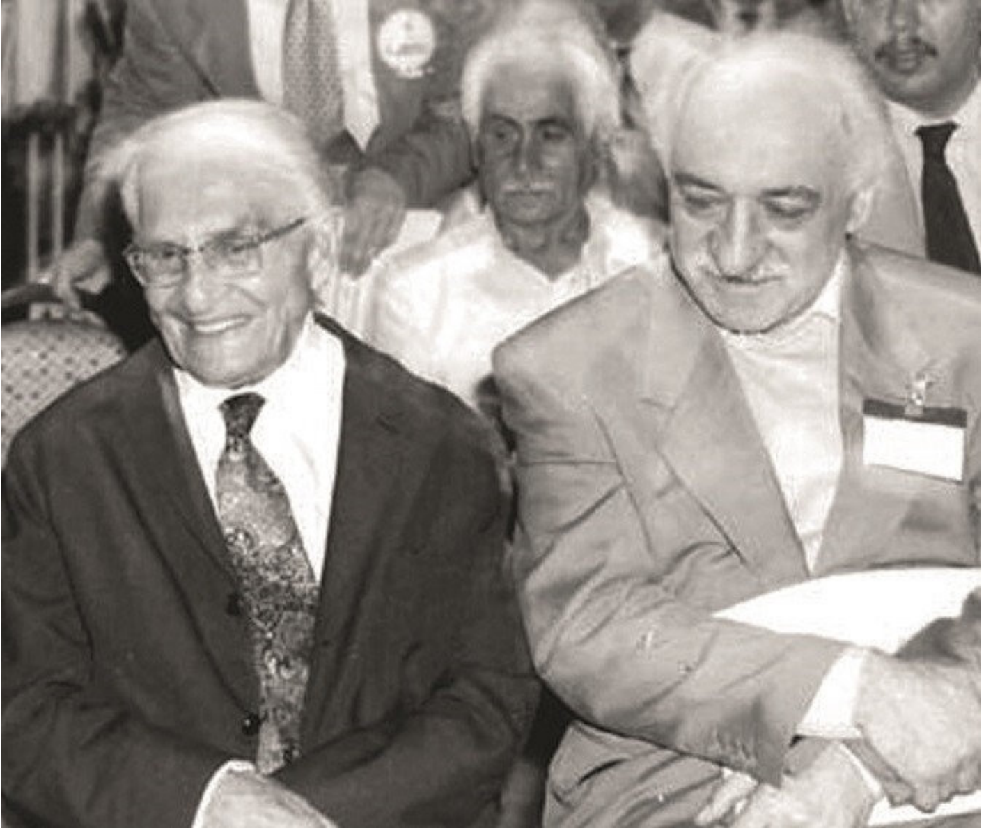
Kasım Gülek - Fetullah Gülen

Raporda Gülen ile CHP'nin mason Genel Sekreteri Kasım Gülek arasındaki yakın ilişkiye de dikkat çekildi: "Fetullah Gülen'in Kasım Gülek ile ilişkileri 1960 yıllarına dayanmaktadır. Fetullah Gülen'in CIA, Mossad ve Moon tarikatı bağlantılarını bilakis Kasım Gülek sağlamış ve birlikte birçok projeye imza atmışlardır."