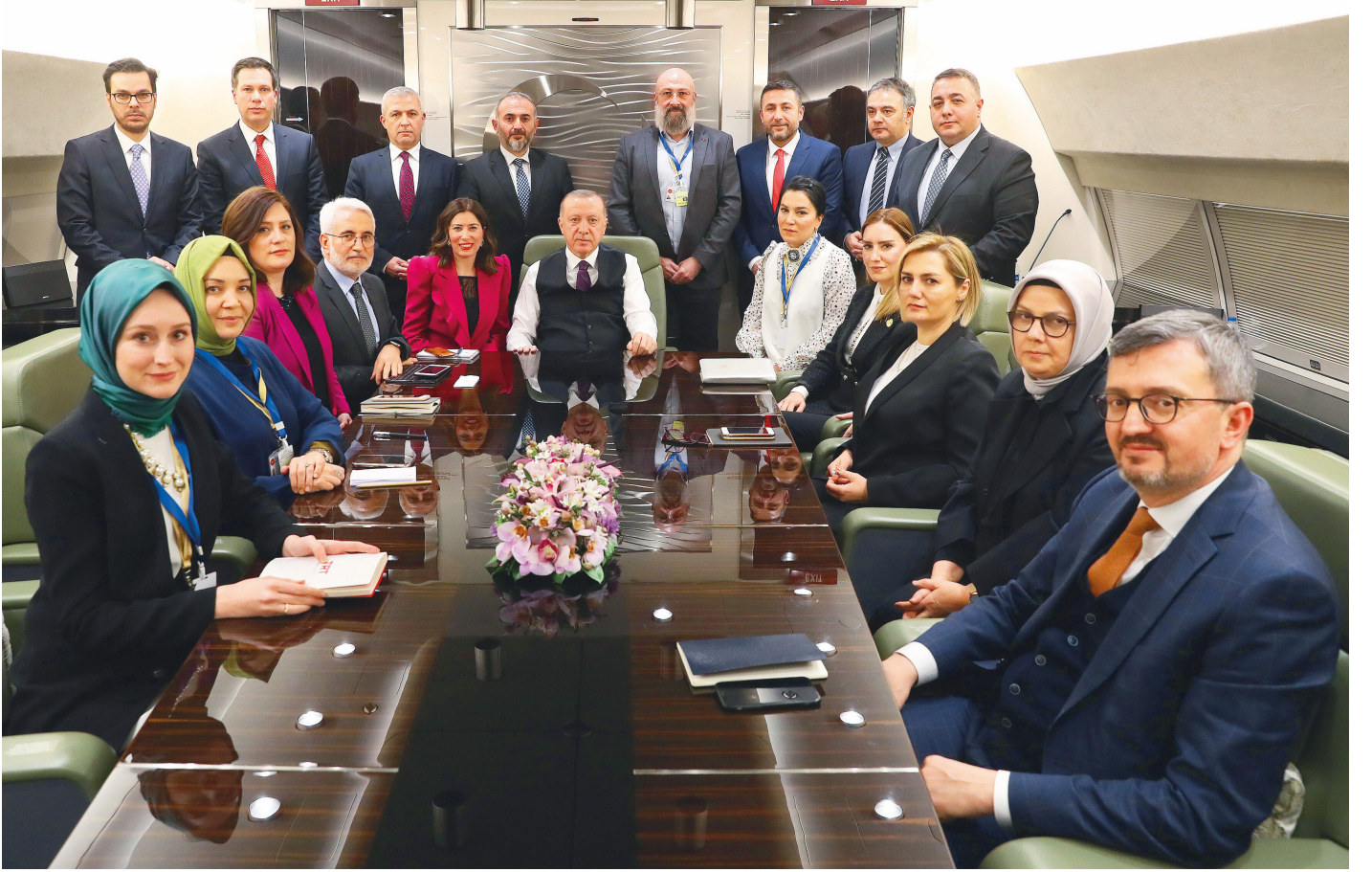
Cumhurbaşkanı Erdoğan Azerbaycan dönüşü uçahta gazetecilerin sorularını yanıtladı.

Aç tavuk kendini buğday ambarında sanırmış. Başka bir şeye gerek var mı? 50 yıl, 60 yıl oldu hep böyle söylediler. Yani maalesef yalandan başka hiçbir sermayeleri yok. Şimdi hepsi bir araya gelecekler... Bizim Erbakan Hoca'nın bir lafı var derdi ki "40 çürük yumurtadan bir sağlam yumurta olmaz." Bunların hepsi çürük yumurta. Bunlardan bir sağlam yumurta olmaz. Hepsi bir araya gelsin, topu bir araya gelsin, bunlardan bir şey olmaz.