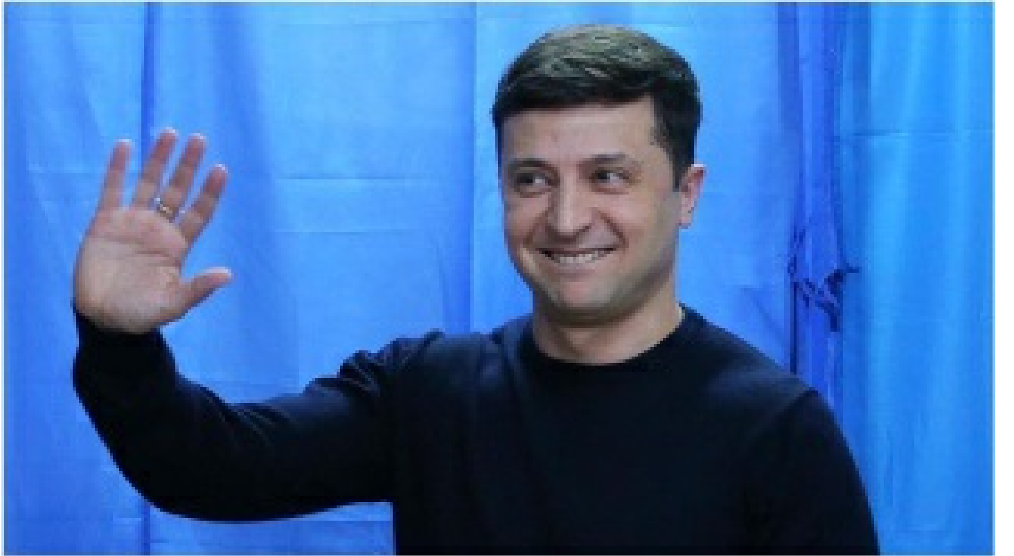
Zelenskiy Ukrayna'dan ayrıldı mı?