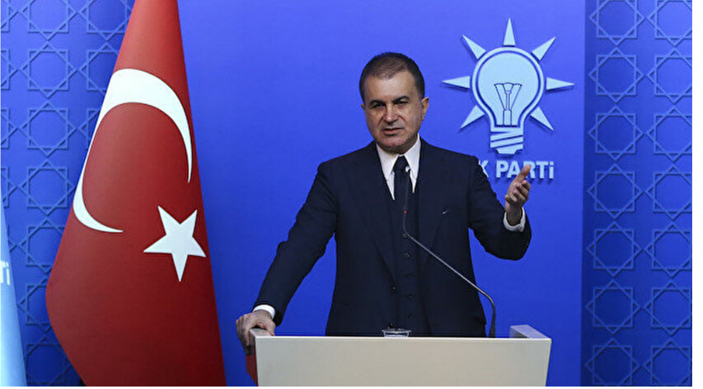
AK Parti Sözcüsü Ömer Çelik

Haber Merkezi • 02 Nisan 2019, 00:05 • Son Güncelleme: 02 Nisan 2019, 00:39 • Yeni Şafak