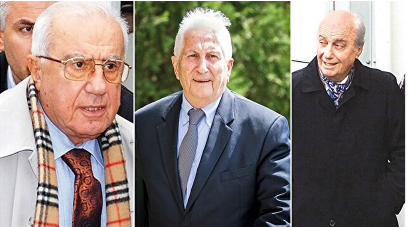
Dönemin Genelkurmay Başkanı İsmail Hakkı Karadayı - Çevik Bir - Çetin Doğan