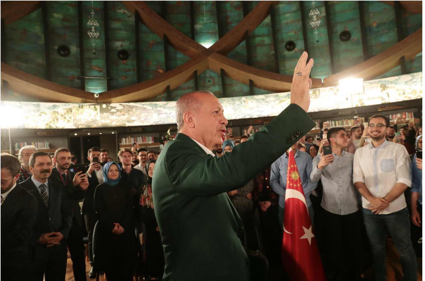
Cumhurbaşkanı Erdoğan, 'Cumhurbaşkanı ile Seçim Özel' programında gençlerle bir araya geldi.

"Büyük Çamlıca Camisi'nin ramazan öncesi açılışını da yapacağız. Bu oyunlara gelmeyelim diye. Çünkü bunlar da bir tahriktir. Tahrik unsurlarını bozalım diye açıklamasını yapmak durumunda kaldım. Orada mesela bir sergi yapıldı, orada Kur'an tilaveti de yaptık. Belli bir bölümünde şu anda namaz da kılınıyor. Bunları da aşmak bizim için sorun değil aşarız ama getirisi, götürüsü nedir? Bunu da burada açıklamam doğru olmaz. Bunun bir götürüsü var. O, bizim için faturası çok daha ağırdır. Unutmayalım dünyanın çok çeşit ülkelerinde bizim binlerce camimiz var. Acaba bunu söyleyenler, bu camilerin başına ne gelir, bunu düşünüyor mu? Şu anda kundaklama hareketleri, bir çok şeyler yapılıyor. Bunları düşünmeden, bunların hesabını yapmadan söylüyorlar. Kusura bakmasınlar bunlar dünyayı tanımıyorlar, muhataplarını bilmiyorlar. Ben bir siyasi lider olarak bu oyuna gelecek kadar istikametimi kaybetmedim. İslam dünyasının yükünü çekiyoruz. 'Nerede, ne oluyor, ne olabilir?' Bunların hepsini düşünmek zorundayız. Onun için hassas olacağız, dikkatli olacağız."