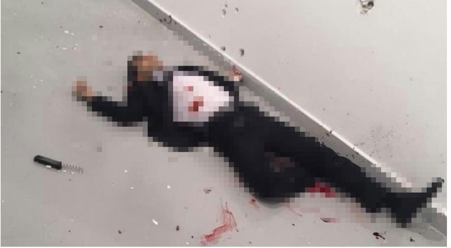
Saldırgan, operasyon sonrası etkisiz hale getirildi.