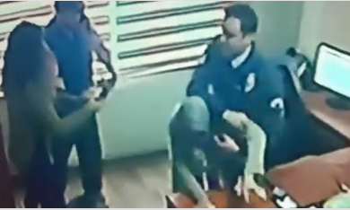
Yardım istedi, darbedilerek dışarıya atıldı