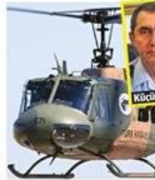
Hava Korgeneralı Hasan Küçükakay

■ Cuntanın Türkiye'deki komuta heyeti dışındaki ekip için merkezi sosyal iletişim ağı QQ.com üzerinden bağlantı kurdu. Türkiye içerisindeki sivil ve asker darbecilerin tercih ettiği oyun sitesi Clash of Kings oldu. Özel sohbet odalarında 15 Temmuz'a kadar şifreli isimlerle görüşmeler yapıldı. 12